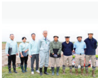
新潟県農業大学校との連携 環境に配慮した農法で収量増を目指し、 収穫米は米菓の原料になっております。