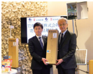
長岡市への支援 モニタリングを行うための水田用の 水位センサーと通信基地局を寄贈

また、地元農家および長岡市と連携し農業振興に貢献することで、原料米の安定確保に繋げてまいります。