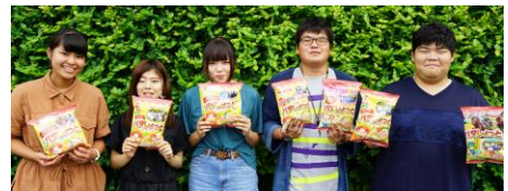
19歳になった子どもたち